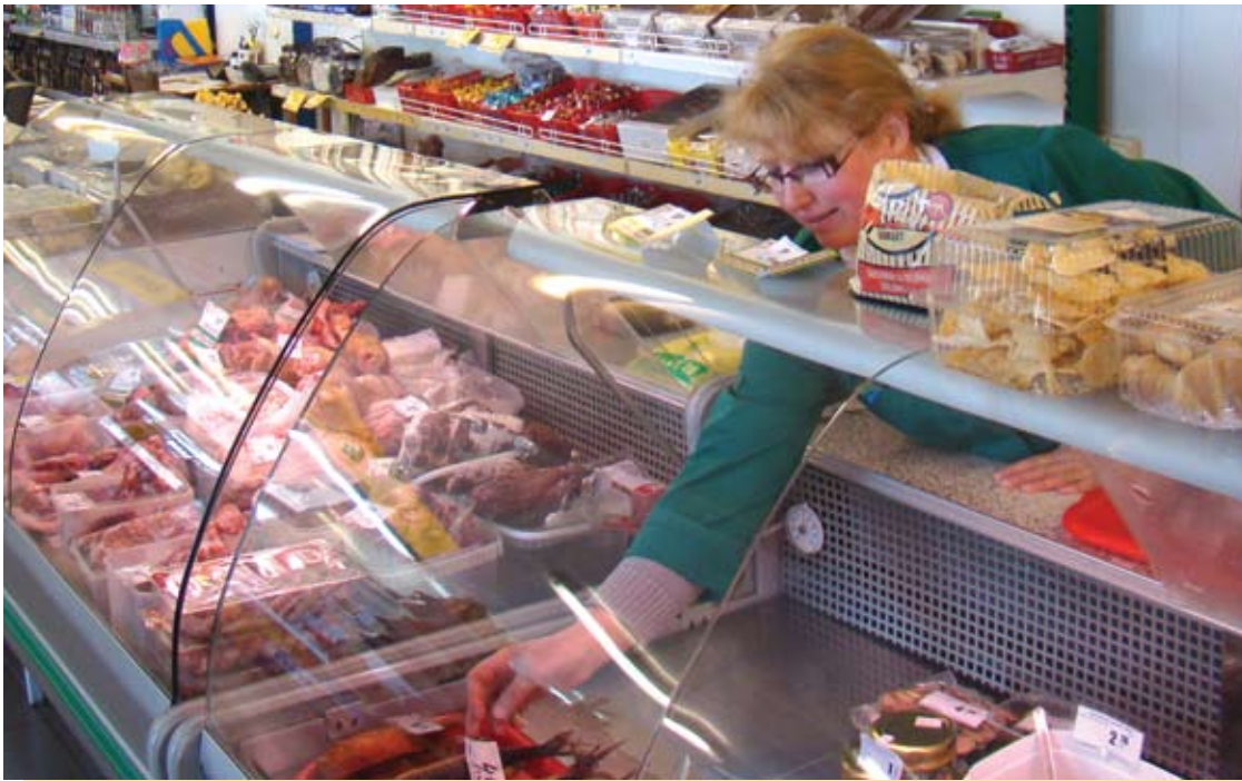
Šalia turgaus esanti Anykščių rajono vartotojų kooperatyvo parduotuvė dažnai sulaukia pirkėjų, kurie kažką pamiršo nusipirkti didžiuosiuose prekybos centruose.

Dar prieš kelias dienas Anykščių miesto parduotuvėse nekantriai mindžikavo eilės pirkėjų, tačiau po Velykų prekybininkams – tikras atokvėpis. Dabar čia užsuka tik vienas kitas pirkėjas, o ir tas renkasi nebrangias, kasdieninio vartojimo prekes. Tuo tarpu prieš šventes, anot prekybininkų, daugelis anykštėnų lentynas šlavė pernelyg neskaiciuodami.