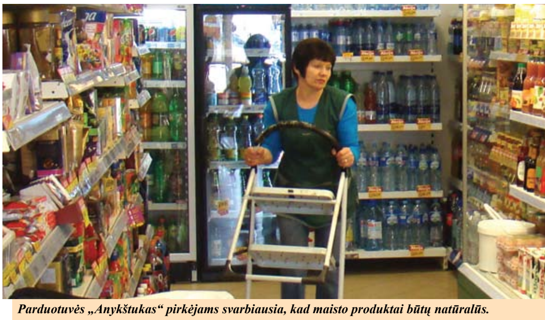
Parduotuvės „Anykštukas“ pirkėjams svarbiausia, kad maisto produktai būtų natūralūs.

Robertas ALEKSIEJŪNAS robertas.a@anyksta.lt