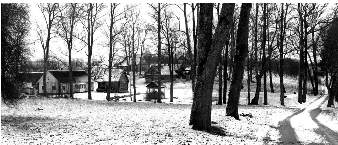
Valakinių kaimo trobos susispietusios viena šalia kitos.

Ražanskai, Papievienė, Riaubai, Juknevičiai